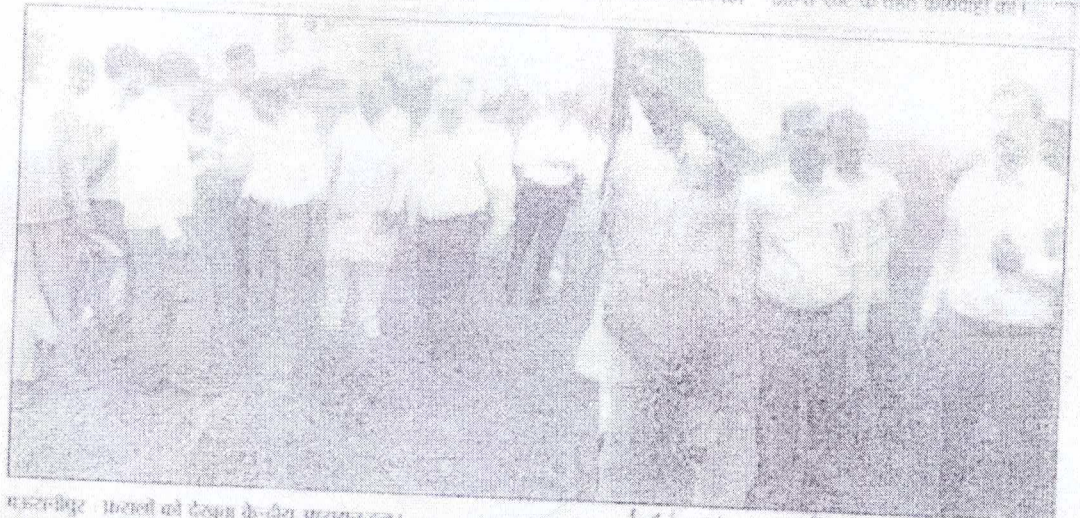
मऊरानीपुर : भारतीय किसान यूनियन के-तीय अध्ययन दल।

ला ने खाया विषाक्त वि। : सदियु हाकाली हिला ने विषाक्त पदार्थ अर लिखा। खानाकोन के कसी 30 वर्षीय महिला को दोपहर विषाक्त वन घर लिखा, हस्त पर परिजन उसे लेकर स्वास्थ्य केन्द्र पहुँचे, वे शॉसी रिपार कर